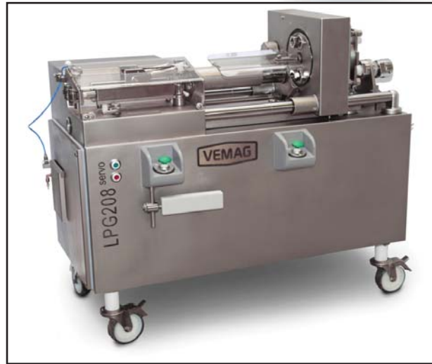
LPG208 servo con cargador de tripa

Una solución integral para (prácticamente) todos los desafíos que presenta la producción de salchichas. Y ahora, la novedad: con cargador de tripa totalmente automático. Esto permite aprovechar aún mejor la elevada velocidad de la LPG208 servo... siempre con el accionamiento de avance de las tripas opcional, y tiempos de cambio de tripa significativamente menores a los de las soluciones convencionales. ¿Más rápido y económico? realmente imposible.